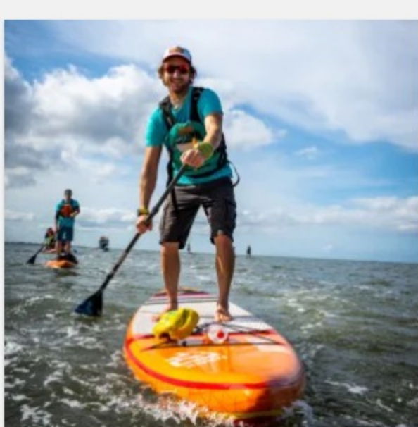
SUP Verleih Lüneburg – 4 Stunden ab 29,00 €