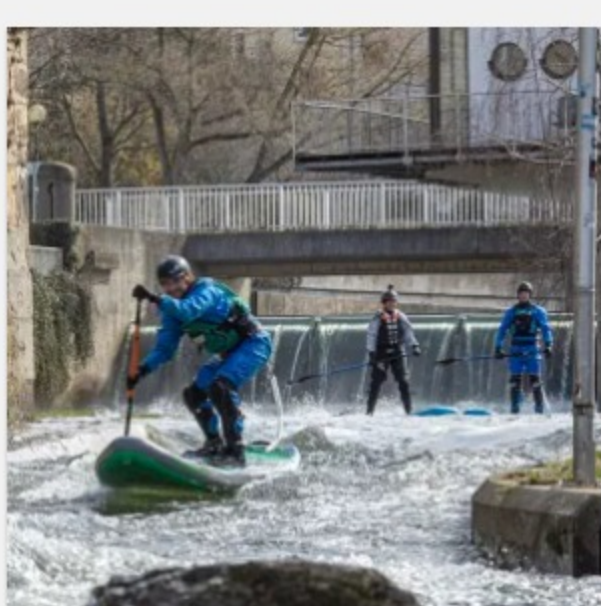
Wildwasser SUP Kurs Hildesheim 19.- 20. Juni 2021 199,00 €

Stand-Up-Paddling – das wolltest Du immer schon mal ausprobieren? Oder hast Du schon Deine ersten Erfahrungen gesammelt und möchtest eine Tour mit paddeln? Finde hier Dein passendes Erlebnis.