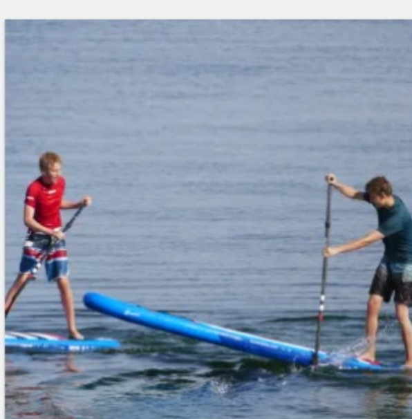
SUP Verleih Lüneburg 1 Tag ab 45,00 €