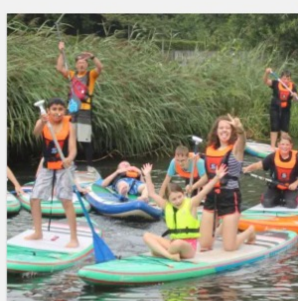
SUP Kids Ferien Camp 2-tägig 135,00 €