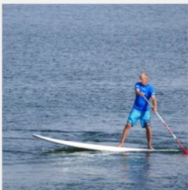
SUP Verleih Lüneburg – 2 Stunden ab 22,00 €