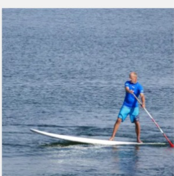
SUP Verleih Lüneburg – 2 Stunden ab 22,00 €

Wir bieten dir die Möglichkeit Boards und Co. zu individuellen Terminen bei uns zu leihen. Du kannst direkt in Lüneburg starten oder Dein SUP handlich gepackt mit zu Deinem Wunschort nehmen. Ob zwei Stunden oder eine ganze Woche; schau Dir unsere Angebote an.