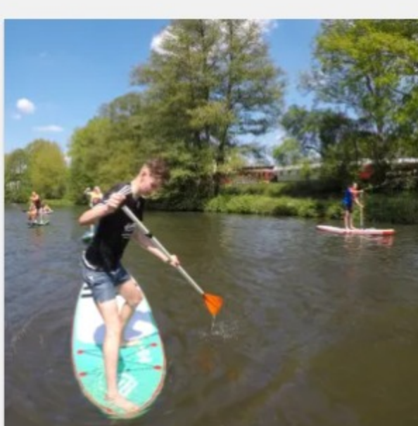
SUP Kurs für Gruppen 35,00 €