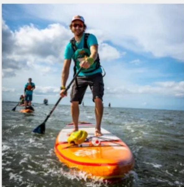
SUP Verleih Lüneburg – 4 Stunden ab 29,00 €