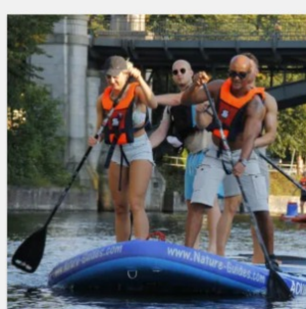
Mega-SUP Verleih Lüneburg 3 Stunden ab 250,00 €