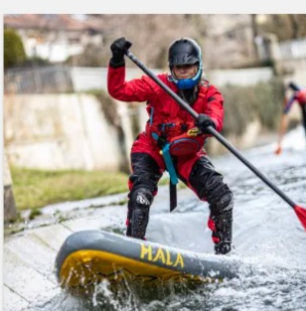
Wildwasser SUP Kurs Hildesheim 02.-03. Oktober 2021 199,00 €