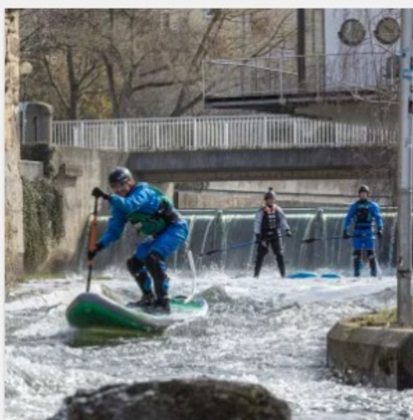
Wildwasser SUP Kurs Hildesheim 19.- 20. Juni 2021 199,00 €